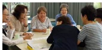
個性光るメンバーの探求心がどう結実するか楽しみ!