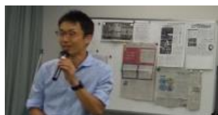
負うた子(孫?)に教わる AI の世界