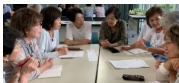
難しいけれど身近な AI。耳はダンボにアンテナ高く。