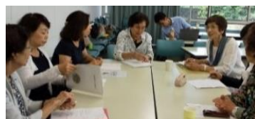
難しいけれど前向きに楽しんで!